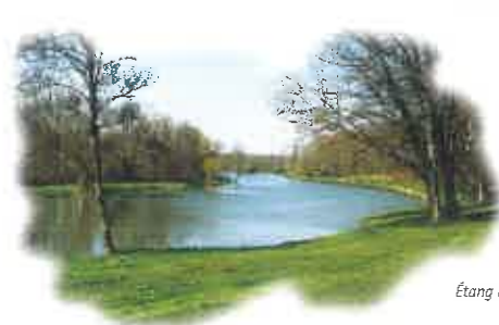
Étang de Boismorand