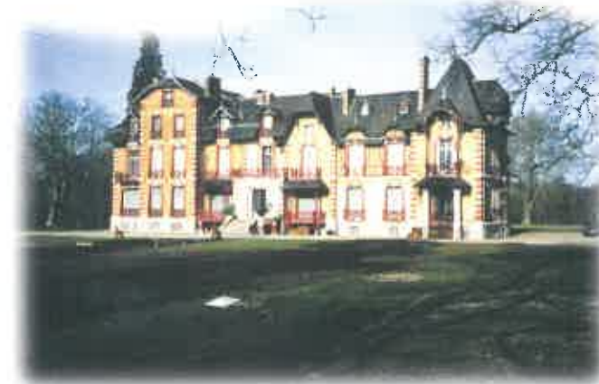
Château du Moulin au Lièvre