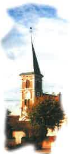
Église des Choux

Document édité par le Comité Départemental de Tourisme du Loiret en collaboration avec le Codérand 45. Tous droits réservés. Édition mai 2000