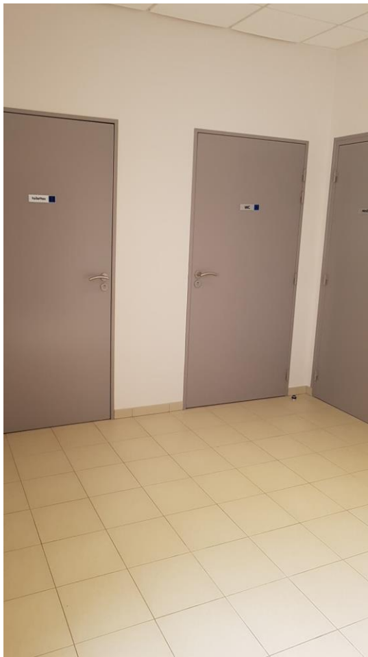
Hall d'entrée – vue accès toilettes