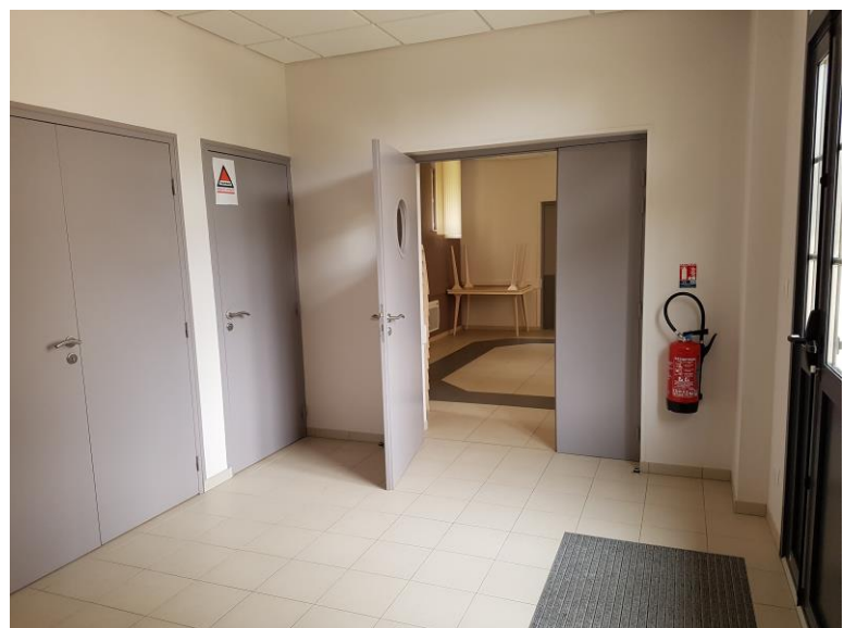
Hall d'entrée – vue accès salle