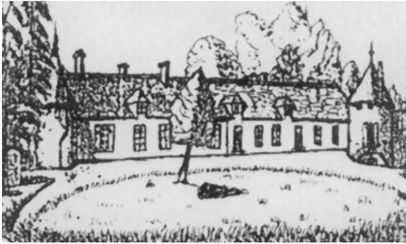
Le château de Langesse tel qu'il apparaît dans la monographie de Jules FAUCHET (Inspecteur primaire de la circonscription de Gien) - Façade Nord-ouest.