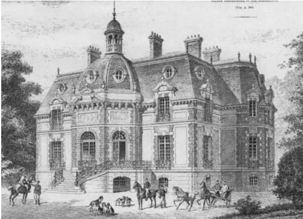
Architecte : Paul GION

Dans les années 1885– 1892, LOREAU décide donc de démolir l'ancien château pour en bâtir un nouveau qui servira de rendez-vous de chasse.