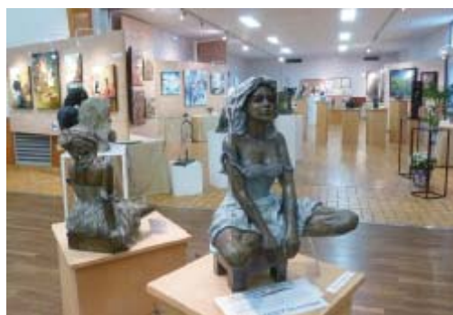
Salon Européen d'Art Contemporain, édition 2020.

Contact par courriel : aps.saintbrissonsurloire@orange.fr